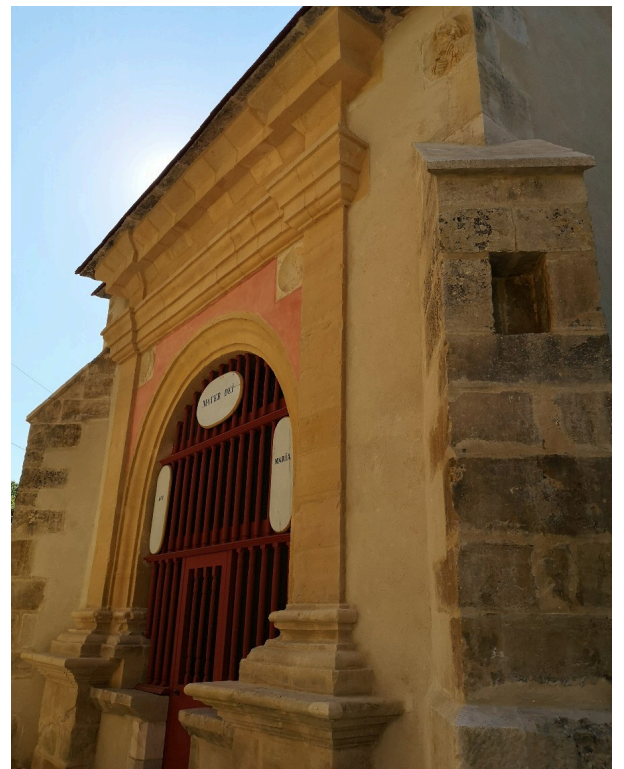
Chapelle Notre-Dame de l'Olm après restauration