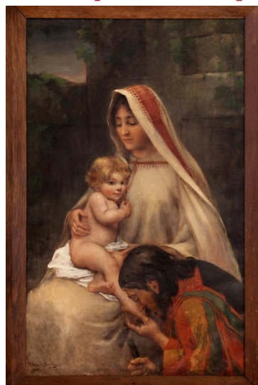
Église de Salviac