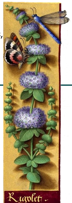
Menthe pouliot , Les Grandes Heures d'Anne de Bretagne, ms. Lat. 9474, f°144v°, BnF

Toutefois, le panel de remèdes médiévaux est bien plus large et n'apportent pas toujours que des bienfaits !