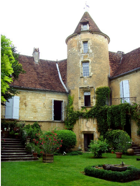
Cour intérieure

Le château se situe à l'extrémité de l' ancien castrum de Salviac.