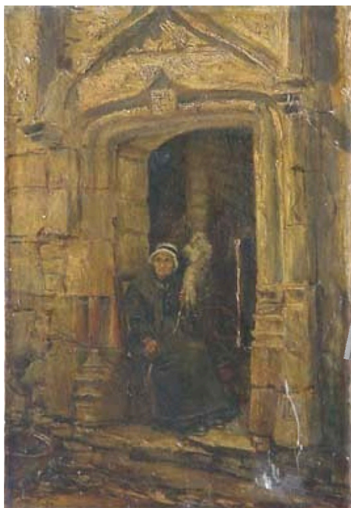
Porte du Château Rouge de Salviac, Marthe BOYER-BRETON, v.1918, Musée de Cahors Henri-Martin

Le fils de Philippe, Benoît de Jean , et son petit-fils, Philippe II de Jean , trahissent le roi de France au profit des Anglais dès 1346.