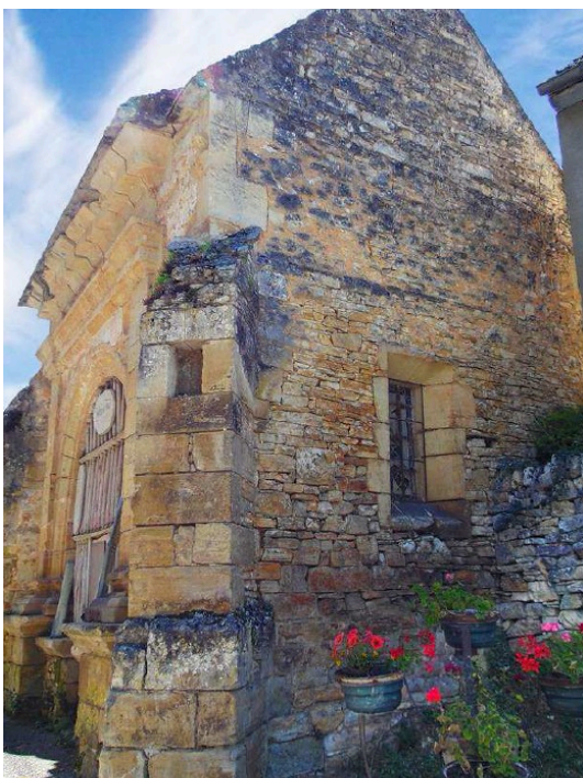
Chapelle Notre-Dame de l'Olm avant restauration

Le portail en bois et les médallions , restaurés, datent de la Renaissance . Le retable est baroque et pourrait être issu des ateliers Tournié .